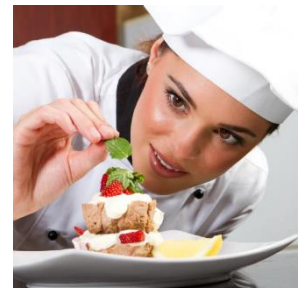
Étkeztetés és Konyha

A könyvelés támogatási szolgáltatást új cégünk, a Fortellum Kft. végzi a korábban már bizonyított vezetői, fejlesztői és támogatói szakember gárdával, az E-Szoftverfejlesztő Kft. maximális támogatásával és garanciájával.